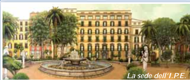
La sede dell'I.P.E.