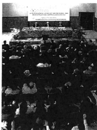
L'aula magna della Residenza Monterone

Il corso di Alta formazione in Finanza avanzata giunge quest'anno alla quinta edizione. Cresce il numero delle richieste di ammissione.